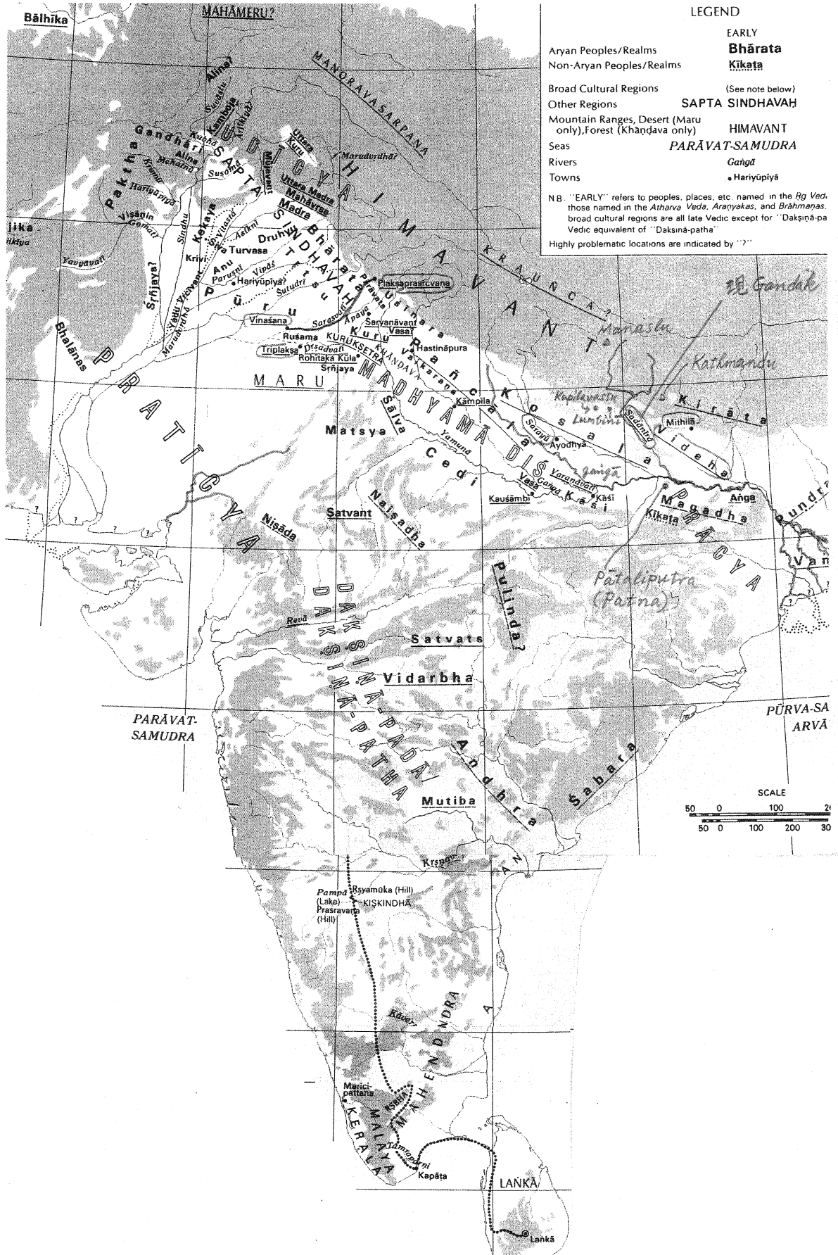
ヴェーダ時代のインド (Schwartzberg ed. A Historical Atlas of South Asia. The Chicago University Press, 1978 より合成)