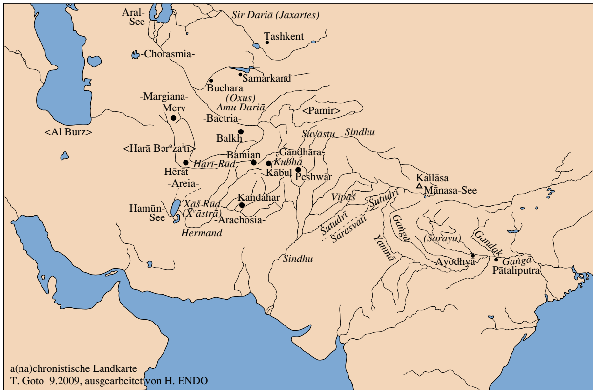
図1 インド・イラン河川図 (後藤描)

諸部族の拡大そのものが原因である可能性もある。彼らの中核は前3千年紀後半にバクトリア・マルギアーナ考古複合 (BMAC) の先進定住文化に出会い、社会制度、契約、宗教、儀礼に亘る大きな影響を受けたことが推測されるが、BMAC 諸都市の城塞はインド・イラン系諸部族の攻撃から身を守る必要から作られたと考えるのが近道だからである。ギムブタス Marija Gimbutas は、これより 1000 年あるいはそれ以上にドナウ河口付近に城塞都市が出現する理由を、攻撃的な「クルガン文化」の担い手たち、すなわち、インド・ヨーロッパ語族の基となった人々が侵出したためと解釈する。それと同様の現象が遅れて東方に押し寄せたことが窺われる。