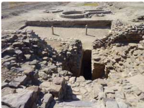
図4 ドーラーヴィーラー、アクロポリス東壁上から西を望む (後藤写)

インダス諸都市の存在は、当時および過去の「世界」のありかたを前提とする。当時の生活実体とその諸条件は、インダス文化圏に見出される一つ一つの項目を深く分析するとともに、背景にあった当時の世界地図の中で有意であった要素を洗い出し、しかるべき位置に置いて立体的に地図と年表の中に構築することによって初めて理解される。このプロジェクトが対象とする時代と地域とは、物理的背景、環地球的ハードウェアの検証点を押さえた上で人間の営みを総合的に吟味検証するのに適した、適度に閉じた実験場である。同時に、考察の対象は広い後背地とその後の展開へと地理的・時間的に開かれている。日高敏隆先生が折に触れて強調されていた“Humanity and Science” に込められた意味が活かされ、一つの典型的成果の提出が期待できる。