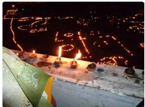
図5 ブジの灯明祭り