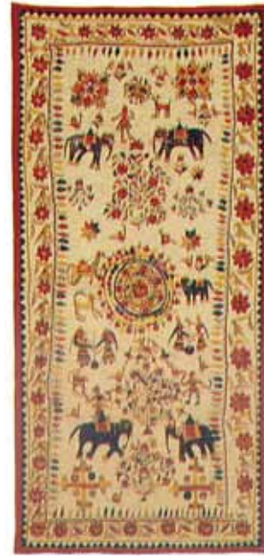
図3 「壁飾り（覆い布）、グジャラート州」

現代に連なる要素として、一つ問題を提起しておきたい。図2はモヘンジョダロ Mohenjo-Daro 出土の名高いインダス印章である。菩提樹の中に角のついた冠をかぶっているように見える女神と覚しき者が立っている。それを、菩提樹の若木のような角のついた冠(?)をかぶる者が崇めているように見える。その右に、二つの波打つ形の角をもつ獣（水牛?）が控えている。下に「女神」と同じ方向を向いて、7人の女性的姿が立っている。彼女たちと樹上の女神とを比べて見ると、女神の特色は両の角にあり、頭の中央の突起物と頭の後ろに垂れ下がる部分は、形はやや異なるものの、下の7人にも共通して